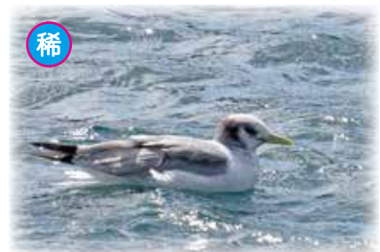
ミツビカモメ 2016年3月18日撮影