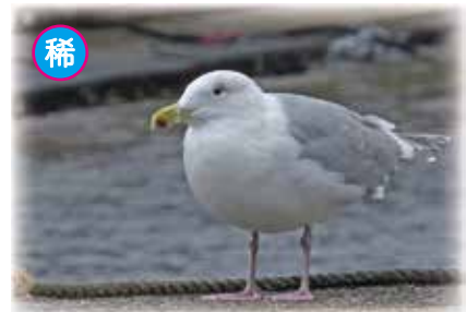
ワシカモメ 2014年2月15日撮影