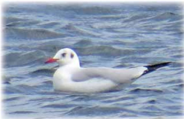
3月4日底土海水浴場で撮影 ユリカモメよりだいぶ大きく見えた

3月1日の昼過ぎ、底土海水浴場にビーチコーミングに出かけました。誰もいない海水浴場を歩いていると、1羽のカモメの仲間がスーッと飛んできました。