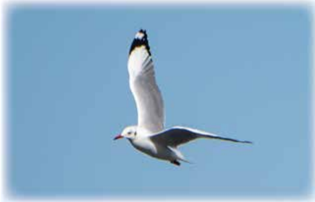
3月1日底土東海汽船棧橋付近で撮影 翼の先の白色部（ミラー）がよく目立つ