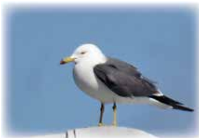
ウミネコ 2024年3月11日撮影