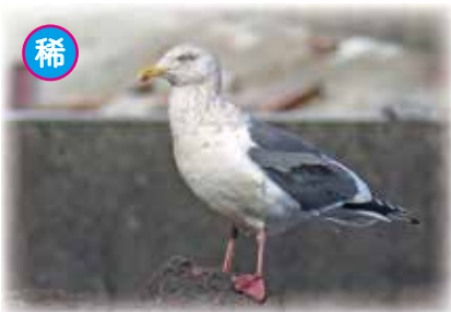
オオセグロカモメ 2020年1月8日撮影

ここではこれまでに八丈島に渡ってきて記録されているカモメの仲間を抜粋でご紹介します！ 八丈島ではどんな種類のカモメたちが記録されているのでしょうか？ (M.K.)