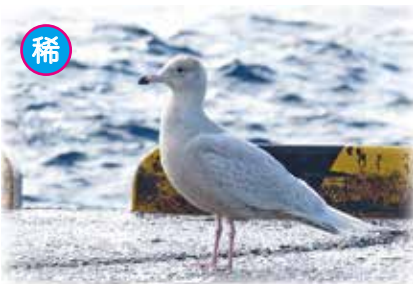
シロカモメ 2020年3月6日撮影