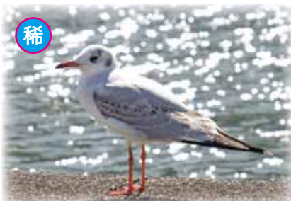
ユリカモメ 2023年10月13日撮影