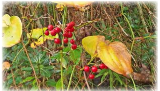
トキワサルトリイバラ Smilax china var. yanagitae 茎に刺がないのが特徴ですが、稀に刺のあるものも。