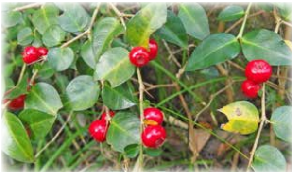
オオアリドオシ Damnacanthus indicus var. major 基本種のアリドオシは「一両」とされているそうです。