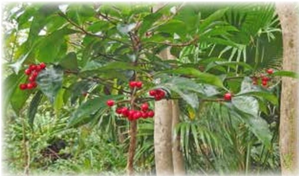
マンリョウ Ardisia crenata 「万両」の字が当てられます。野生種は少し地味？