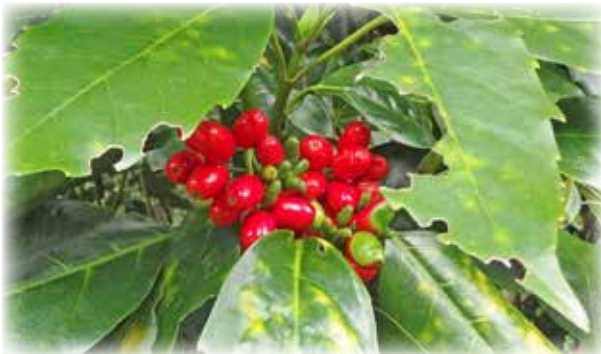
アオキ Aucuba japonica var. japonica 庭木の印象が強いです。八丈島にも自生しています。