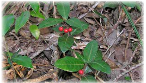
ヤブコウジ Ardisia japonica 別名「十両金」とも呼ばれる縁起物の植物です。