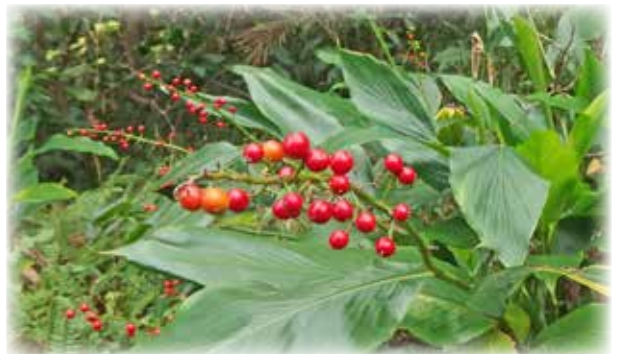
アオノクマタケラン Alpinia intermedia 八丈島の冬の林床を賑やかに彩ってくれています。

「アカコッコ」は日本固有のヒタキ科（旧ツグミ科）の鳥で、国の天然記念物に指定されています。八丈島では一年を通して見られ、町の鳥にも選定されています。