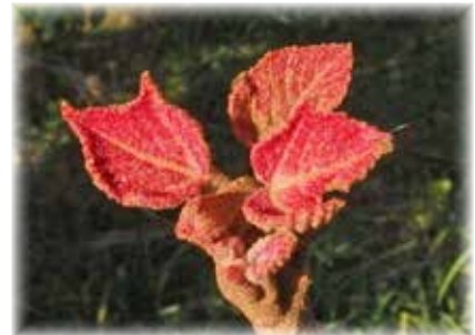
アカメガシワ 展開し始めた新葉には紅い星状毛がびっしりと生えています。