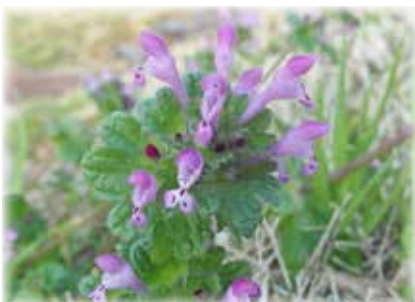
ホトケノザ 対生して茎を抱く上部の葉の様子を、仏像の台座の蓮華に見立てた名前のようにです。