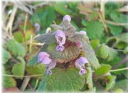
ヒメオドリコソウ 全国的によく知られている春の花ですが、八丈島では意外に少ない野草です。