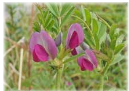
カラスノエンドウ 昔の子供は鞆で笛を作って遊んだものですが、今の子供達はもうどうでしょう？