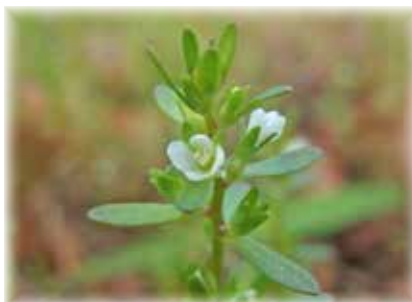
ムシクサ 虫こぶができるのが名前の由来ですが、八丈島ではその虫こぶを見かけません。