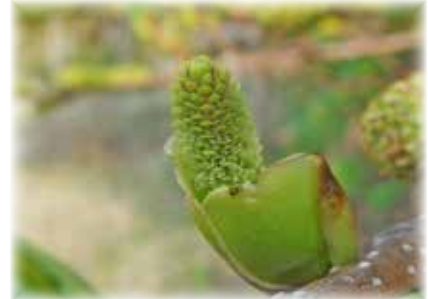
オオバヤシャブシ 雄花の花粉はアレルギーの原因として知られていますが、こちらは雌花です。