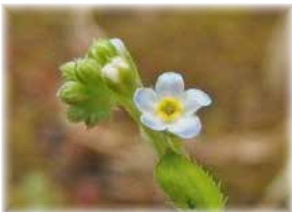
キュウリグサ 葉を揉むとキュウリに似た臭いしますが、感じ方には個人差があります。