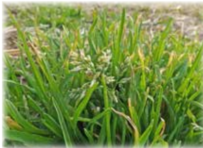
スズメノカタビラ この仲間は葉先が舟形になるのが特徴です。雑草になると結構始末が悪い？