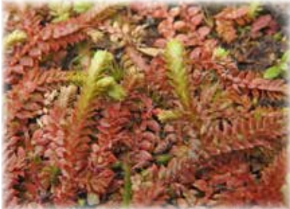
タチクラマゴケ 紅葉した葉を付けた枝の先に新芽が成長し始めています。

そこで当日歩くコースをスタッフだけで調査してきましたので、その中から春らしい植物を紹介します。