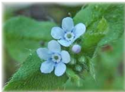
ハナイバナ 漢字では(葉内花) 茎頂に花穂を付けるキュウリグサと対比した名前でしょうか？