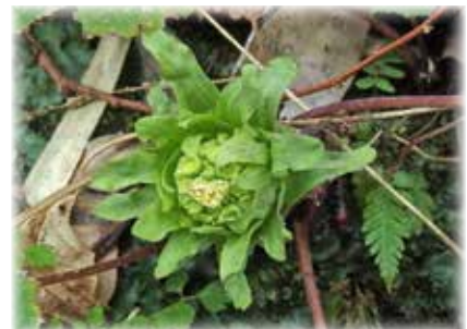
フキ 「落の臺」として全国的に有名ですが、八丈島では食材としてそれほど人気がありません。