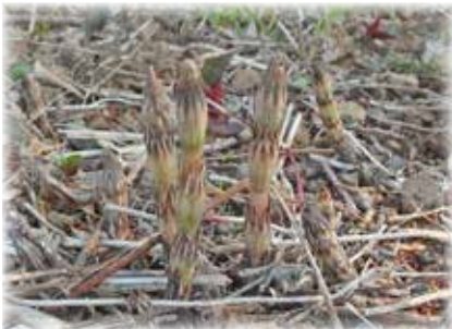
スギナ ご存じのように、ツクシ(土筆)はシダ植物であるスギナの孢子葉です。