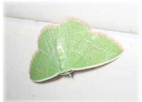
ヨツテンアオシャク