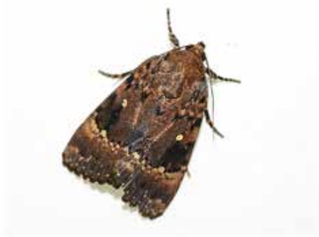
オオシマカラスヨトウ