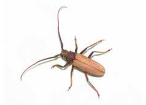
アマミトゲウスバカミキリ八丈島亜種