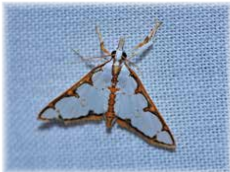
モンキシロノメイガ