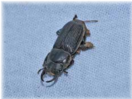
ハチジョウネブトクワガタ