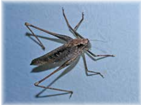
タイワンクツワムシ