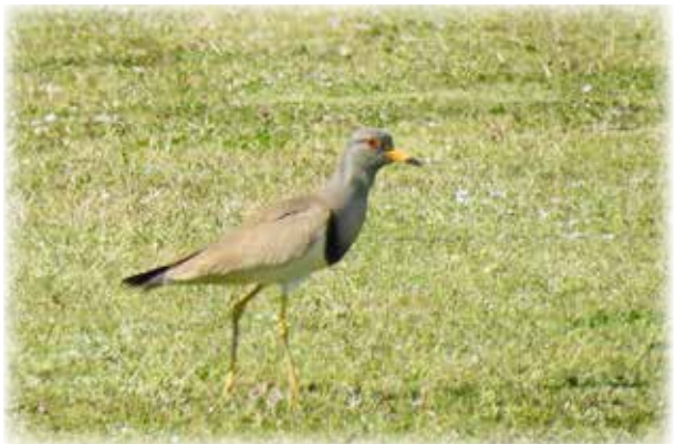
目つきが少し怖いケリ

「アカコッコ」は日本固有のヒタキ科（旧ツグミ科）の鳥で、国の天然記念物に指定されています。八丈島では一年を通して見られ、町の鳥にも選定されています。