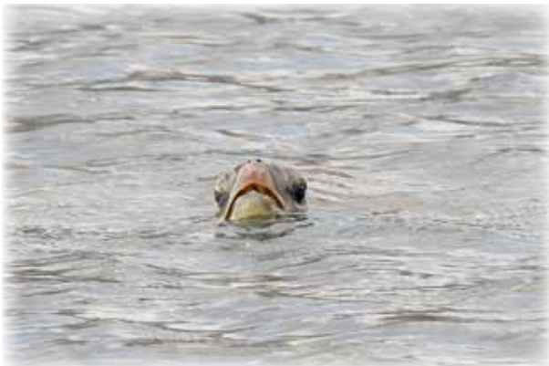
息継ぎのために水面に顔を出したアオウミガメ

これから春にかけて、八丈島では陸上からのザトウクジラ探しに挑戦するのも楽しみの一つです。