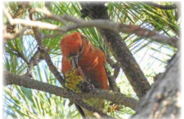
クロマツの種を器用に取り出して食べるイスカ