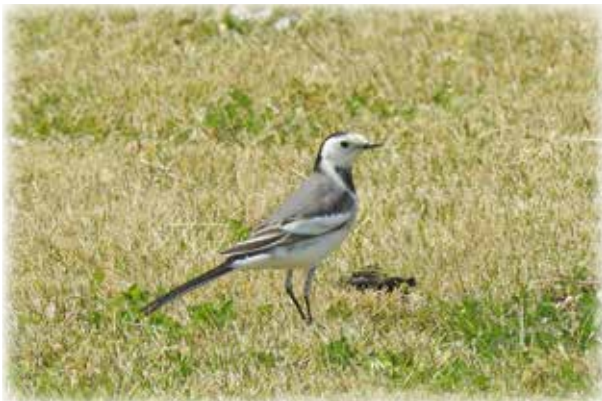
ハクセキレイだと思って通り過ぎてはいけない 亜種ホオジロハクセキレイ