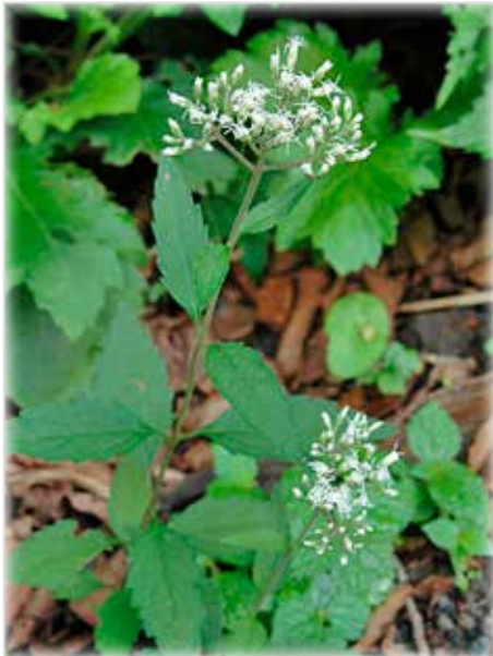
ヒヨドリバナ Eupatorium makinoi 明るい林道脇などでよく見られます。アサギマダラなどの秋の蝶がよく似合います。