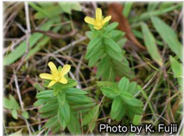
ハチジョウオトギリ Hypericum hachijoense 自生地は限られているので出会えたらラッキーです。