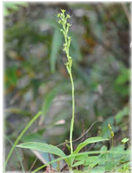
ムカゴトンボ Habenaria flagellifera 地味な色合いですが、カイゼル髭のような唇弁の側裂片の形が面白い野生ランです。

「アカコッコ」は日本固有のヒタキ科（旧ツグミ科）の鳥で、国の天然記念物に指定されています。八丈島では一年を通して見られ、町の鳥にも選定されています。