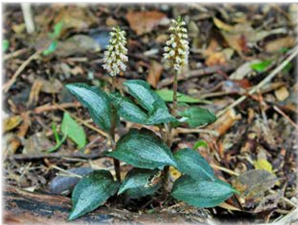
ハチジョウシユスラン Goodyera hachijoensis やや暗い林床で見られます。葉の白い模様は様々。