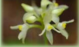
ハチジョウネツタイラン