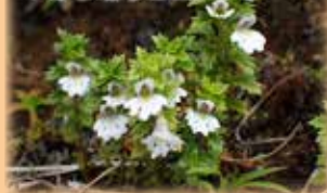
ハチジョウコゴメグサ