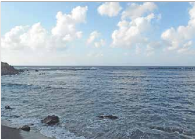
満潮時の底土東浦海岸 2019年 6月16日 17:00 上の写真では潮だまりは確認できません。

潮だまりは干潮時に波打ち際に取り残された小さな海ですから、それを楽しめるチャンスは限られています。