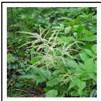
シマヤマブキショウマ Aruncus dioicus var. insularis

八丈島では、内地と少し様変わりした種や独自に進化した種など、聞き慣れない種があるのが特徴です。今回は、「シマヤマブキショウマ」にスポットを当ててみたいと思います。