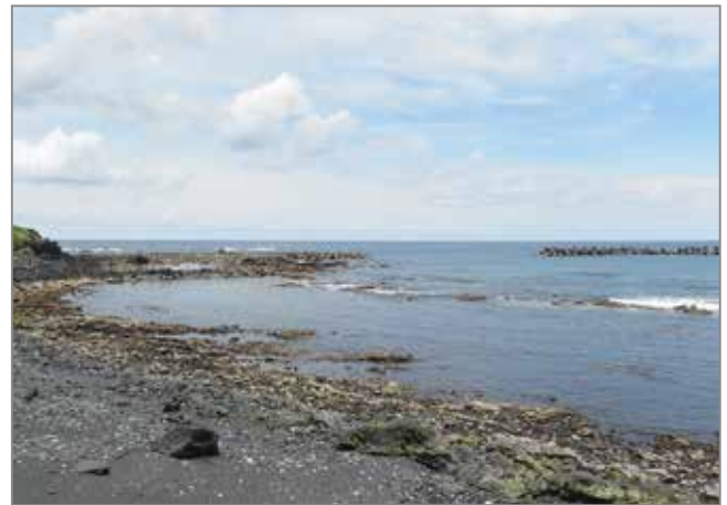
干潮時の底土東浦海岸 2019年 6月18日 12:00 手前に広大な潮だまりが出現しました。

2019年の6月17日は満月で、潮の満ち引きが最も大きい大潮にあたっていました。大潮は満月の時と新月の時に起こるので、おおむね一ヶ月に2度のチャンスがあります。また、満潮と干潮は一日の内で2回ずつあるので昼間の干潮時を狙うのがお勧めです。4ページ目のカレンダーに7月の満潮・干潮の時間が載っています。